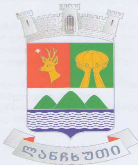
ლანჩხუთის მუნიციპალიტეტის გერბი